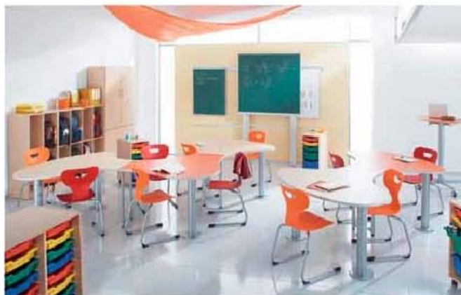
So schön kann Schule sein: Innovative Klassenräume von project.