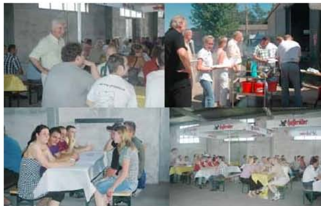
15 Jahr project das musste gebührend mit allen Mitarbeitern gefeiert werden.