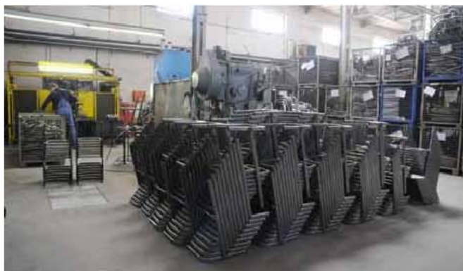
Starke Saison 2010: Hochbetrieb nicht nur in der Gestellfertigung.