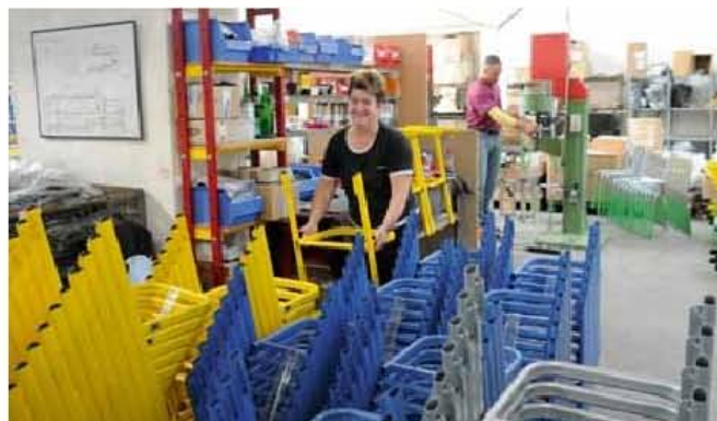
Fertigung und Endmontage (hier von Schülerstühlen) haben alle Hände voll zu tun.