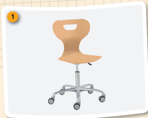
Der Drehstuhl solit:sit (ab. S. 66) wirkt starrem Sitzen entgegen und unterstützt damit die Konzentration.