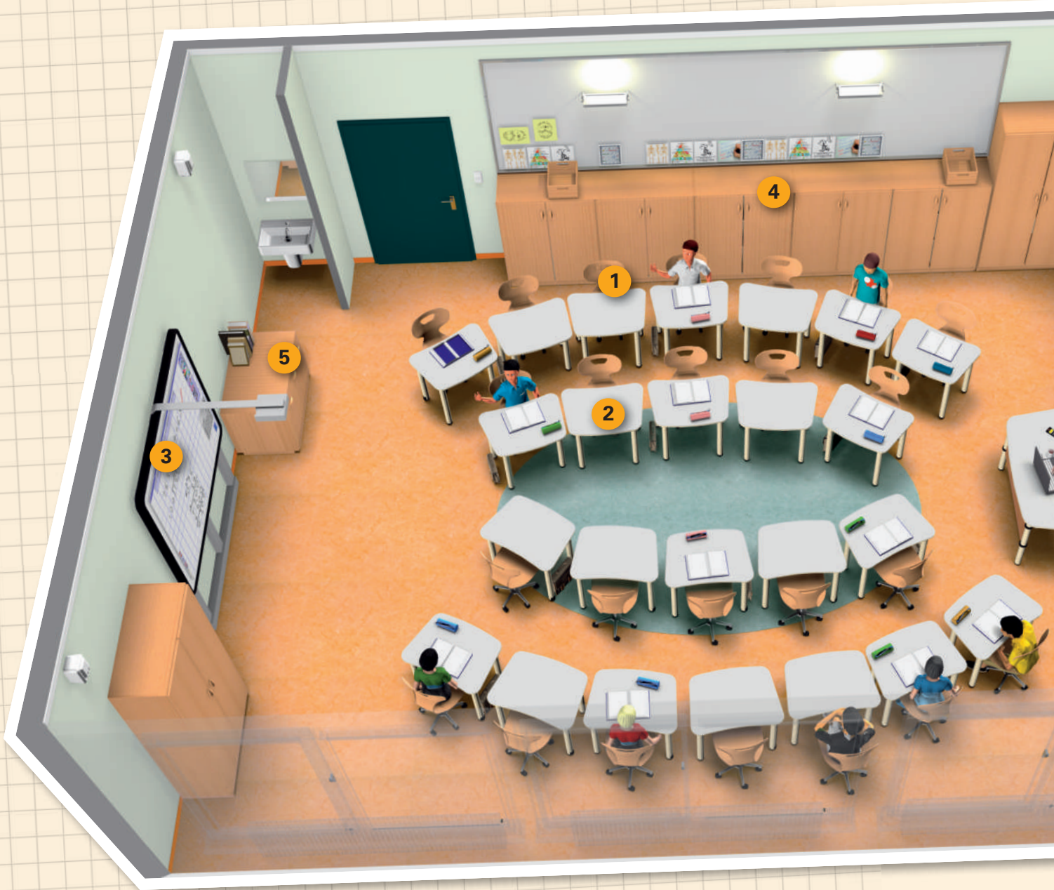
Ein Muss im Apendarium: die harmonische Abstimmung aller Farben